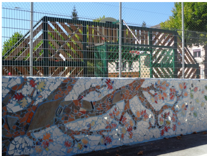
Œuvre participative joutant le terrain de jeux

Ces divers travaux ont fait l'objet d'un crédit supplémentaire d'un montant de CHF 45'000.- TTC, voté par le Conseil municipal lors de sa séance du 18 juin 2015.