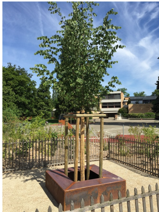
Tilleul planté à l'école du Belvédère

Des arbres et arbustes à fleurs ont été plantés en lieu et place des acacias qui se trouvaient sur une butte en lisière du préau de l'école du Belvédère. Un tilleul, positionné centralement, amènera dans le futur de l'ombre à la place adjacente. De plus, les parents des jeunes nageurs du club Chêne-Bougeries Natation pourront dorénavant suivre les progrès de leurs protégés sur un mur siège, laissant les petites sœurs et petits frères courir sur une surface amortissante. Une rampe d'accès a également été créée.