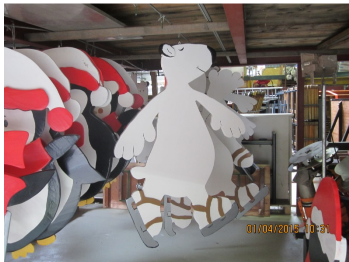
Décorations de Noël 2015

Le service Jeunesse, prévention et sécurité a accueilli bon nombre de jeunes pour des stages et collabore étroitement avec le service des Affaires culturelles en mettant à disposition le matériel logistique nécessaire ainsi que ses connaissances techniques pour que chaque manifestation et exposition soit une réussite.