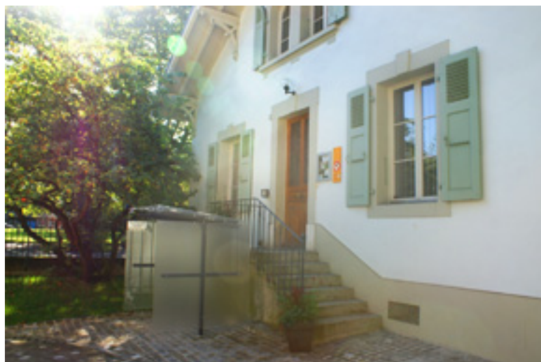
Entrée du service des Affaires sociales au 6, route du Vallon

Au cours de la période comprise entre le 1 er juin 2013 et le 31 mai 2014, 15 logements ont été attribués à des nouveaux locataires, sur la base de critères d'attribution pour les logements élaborés par la commission Affaires sociales du Conseil municipal.