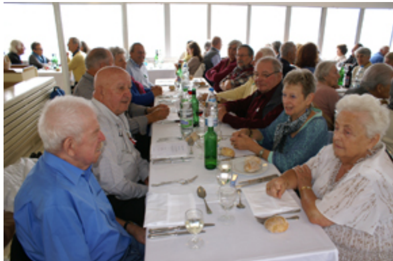
Sortie des Aînés 2013 en croisière sur le Lac Léman

Comme chaque année, plus de 880 kg de pommes et 1'350 kg de pommes de terre ont été offerts et distribués à l'automne 2013, puis au printemps 2014, à près de 80 foyers.