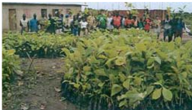
Projet Mongaada villages Togo :

L'équipe franco- suisso-togolaise derrière une pépinière de teck