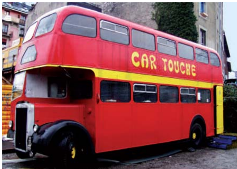
« Car Touche », le bus londonien de Carrefour-rue