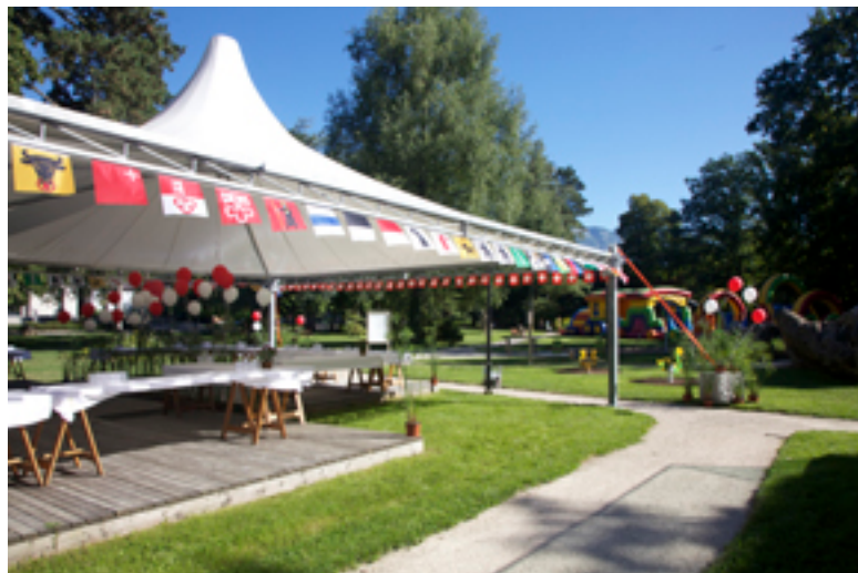
Grande tente du 1 er Août 2013

L'équipe de ce service extérieur répond également à la demande des habitants de la commune qui organisent leurs propres manifestations. La mobilisation de ses collaborateurs est très largement reconnue et saluée par la population.