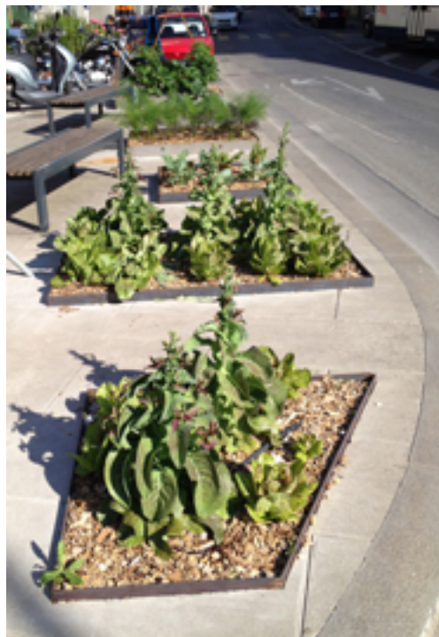
Potager urbain – rue de Chêne- Bougeries

Pour répondre aux besoins grandissant en places d'accueil du restaurant scolaire de Conches, un pavillon provisoire a été construit en limite de la propriété communale. Le service des parcs et promenades en a aménagé le pourtour, désormais orné de copeaux et de gravier de rivière lavé. Un écran végétal de graminées sépare le pavillon de la rue, tout en laissant passer la lumière naturelle.