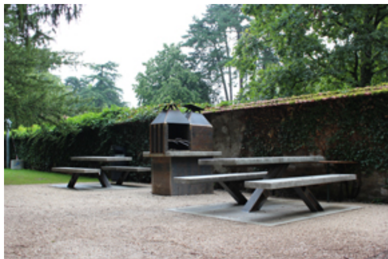
Le nouvel espace grillades au parc Stagni

Suite au succès rencontré par un espace de grillades provisoirement installé dans le parc Stagni, le service des parcs et promenades a conçu, dessiné et construit un aménagement pérenne, achevé au début de l'été 2014. Quelques kilos de ferraille, de grave calcaire, de béton, d'idées, de compétences ont suffi à transformer cet endroit triste et boueux en un espace convivial, dans un cadre ombragé et protégé, respectueux de la faune et de la flore.