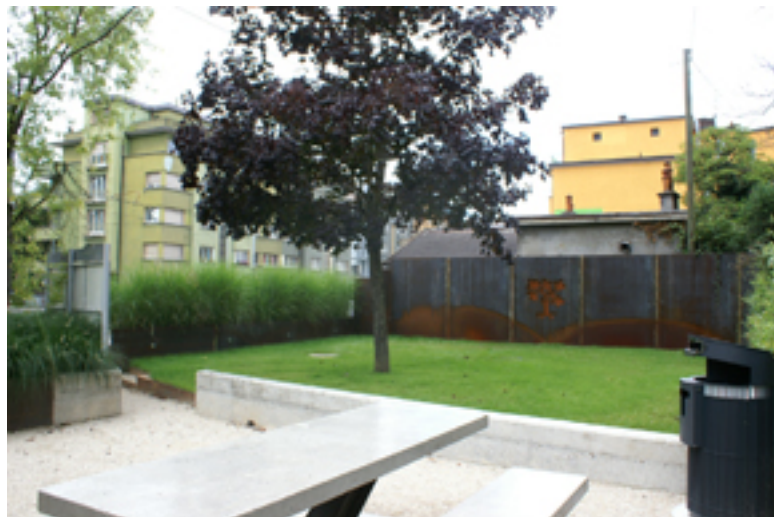
Intérieur du square Puthon réaménagé

Dans l'herbe verdoyante, il est à présent possible de s'octroyer un moment décalé, posé sur un transat ou de prendre un encas sur une table design, créée par le service des parcs et promenades. Un arrosage automatique a été installé pour veiller à l'hydratation des parterres verts ou des graminées. Un nouvel éclairage flirte avec la nuit. Les armoiries de Chêne-Bougeries se découpent délicatement d'une fine paroi d'acier, qui sépare désormais le square de l'immeuble voisin.