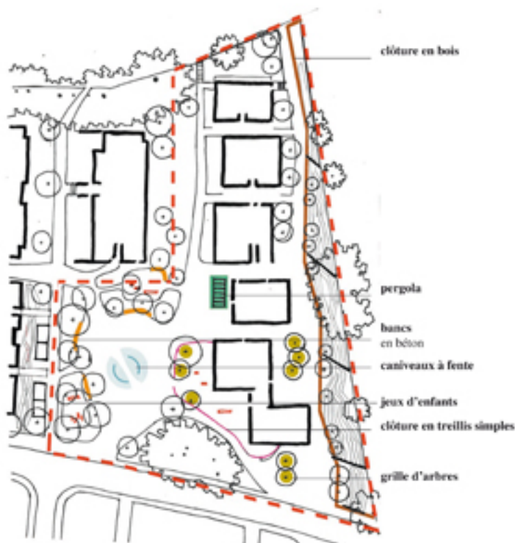
Plan du projet d'aménagement des espaces extérieurs

Enfin, le Conseil municipal a encore décidé de voter un crédit d'investissement et financement d'un montant de CHF 2'447'630.- TTC en lien avec des travaux d'aménagement des espaces extérieurs, dont la qualité constituait au demeurant un point particulièrement significatif du cahier des charges du concours en coopératives lancé en 2011. La problématique de la gestion des eaux à la parcelle y est intégrée, puisqu'elle avait fait l'objet d'études fouillées, lesquelles ont débouché sur un projet consistant à créer en limite est de la parcelle, un « canal » d'évacuation à ciel ouvert. Un concept qui avait déjà rencontré l'accord de principe de la Direction générale de l'Eau, service cantonal compétent en la matière.