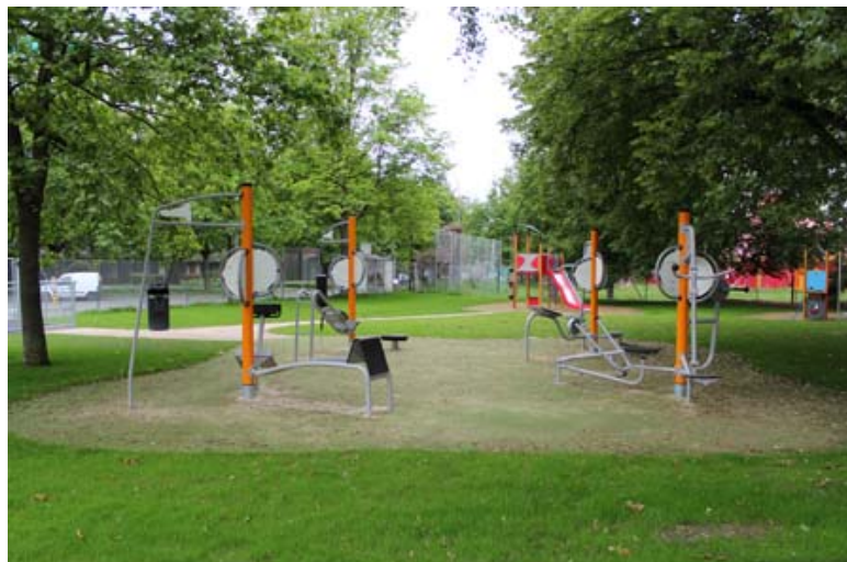
Station de gym dans le parc réaménagé à la Gradelle

Le cadre verdoyant a bien sûr été conservé et même agrandi. Un arrosage automatique très précis permet de répondre aux besoins spécifiques de chaque plante. Un tableau électrique enterré complète le dispositif pour fournir de l'énergie à Cirquenchêne, école de cirque qui monte son chapiteau quelques mois par an sur un terrain adjacent, ainsi qu'aux autres associations.