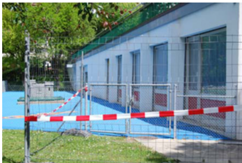
Le « Petit Manège » a été transformé et rénové d'avril à août 2014.

En effet, l'étanchéité de ce bassin-fontaine, lequel avait fait l'objet d'un concours initié le 14 février 2009 en vue d'installer une œuvre artistique pérenne, demeurerait problématique nonobstant une série de travaux complémentaires réalisés en 2011 et 2012. La reprogrammation des jets d'eau et de lumière, dont la couleur est sensée varier au gré des saisons, sera confiée à l'École de mécatronique industrielle de Genève.